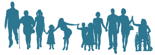
HOSPIZGRUPPE Aschaffenburg e.V.

Sterben müssen wir alle - die Frage ist nur wann und wie? Die Hospizgruppe Aschaffenburg bietet die Beratung und Begleitung von unheilbar erkrankten und sterbenden Menschen und deren Angehöriger. Die ehrenamtlichen Hospizbegleiter unterstützen dabei in vertrauter Umgebung, unter Achtung der persönlichen Bedürfnisse und Wünsche. Sie leisten Lebensbeistand bis zuletzt. Unterstützung zur richtigen Zeit am richtigen Ort. www.hospizgruppe-aschaffenburg.de